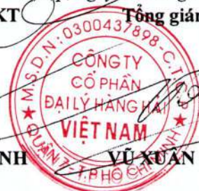
VŨ XUÂN TRUNG